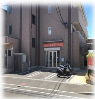
ライフサポートあさひ 大東市御領2丁目2-8 ☎ 072-869-5552