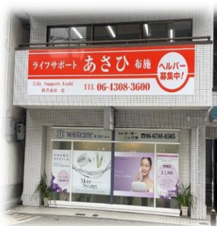
ライフサポートあさひ布施 東大阪市長堂2丁目10-24 ☎ 06-4308-3600