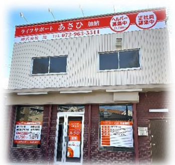
ライフサポートあさひ加納 東大阪市加納1丁目10-8 ☎ 072-963-5511