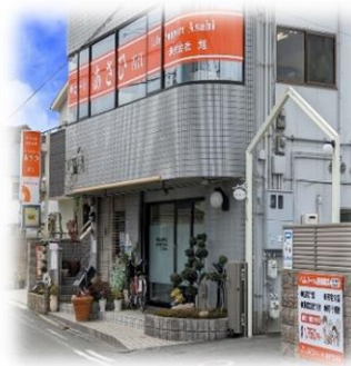
ライフサポートあさひ若江 東大阪市若江本町4丁目2-4 ☎ 06-6722-5552